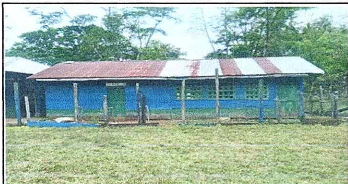
Foto1: Se cambiara laminas, costaneras y se reemplazaran canales.